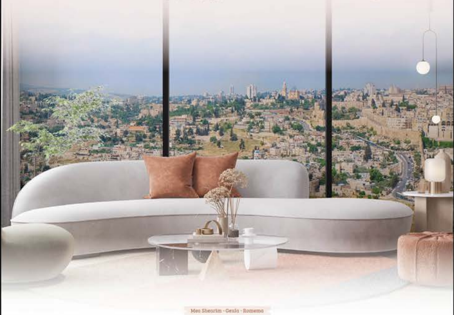
Meu Shearim - Gessie - Romema

Our top vacation accommodation, our 24/6 Priority Your Best Vacation Ever!