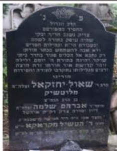
ציון קדשו בעיר מיהאלעווין

צו נעמען א חלק אין די גרויסע הוצאות רוף 917-819-2887