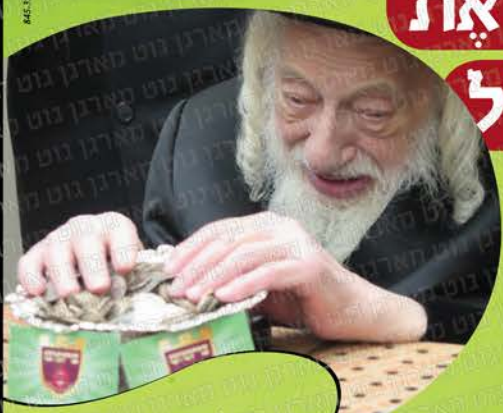
ליב מריר'ס סקאלון סלסול סקאלון מליליט סקאלון מליליט סקאלון