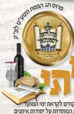
פוסט חג הפסח תשע"ט ל"ב' ק' קאמפיין