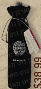
1848 Reserve $38.99