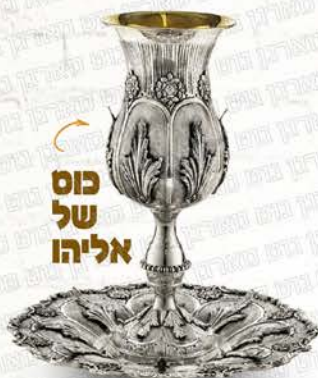
כוס של אליהו