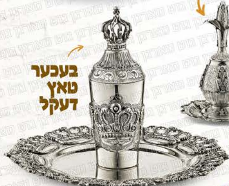
בעכער טאץ דעקל