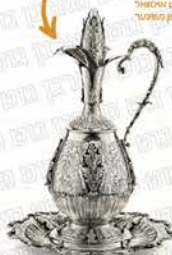
אר קענט זען מיט כלי מלכות בייס סדר טיש