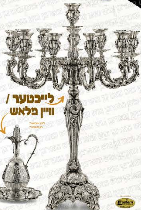
לייכטער / וויין פלאש